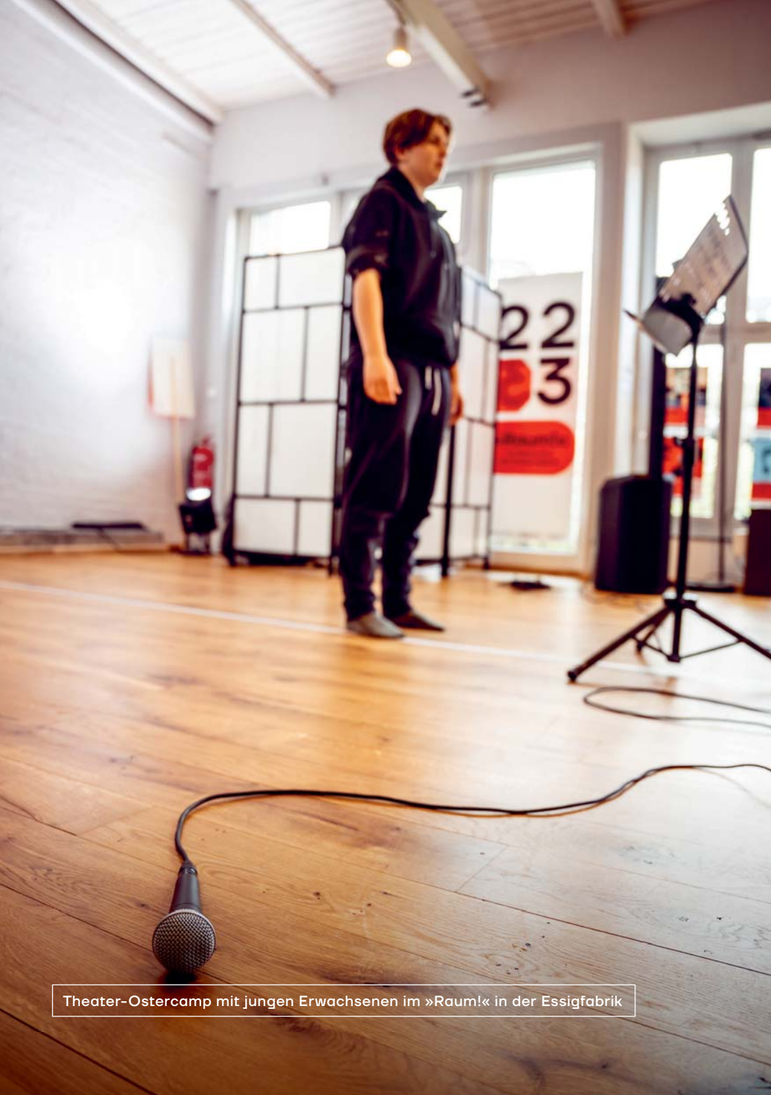
Theater-Ostercamp mit jungen Erwachsenen im »Raum!« in der Essigfabrik