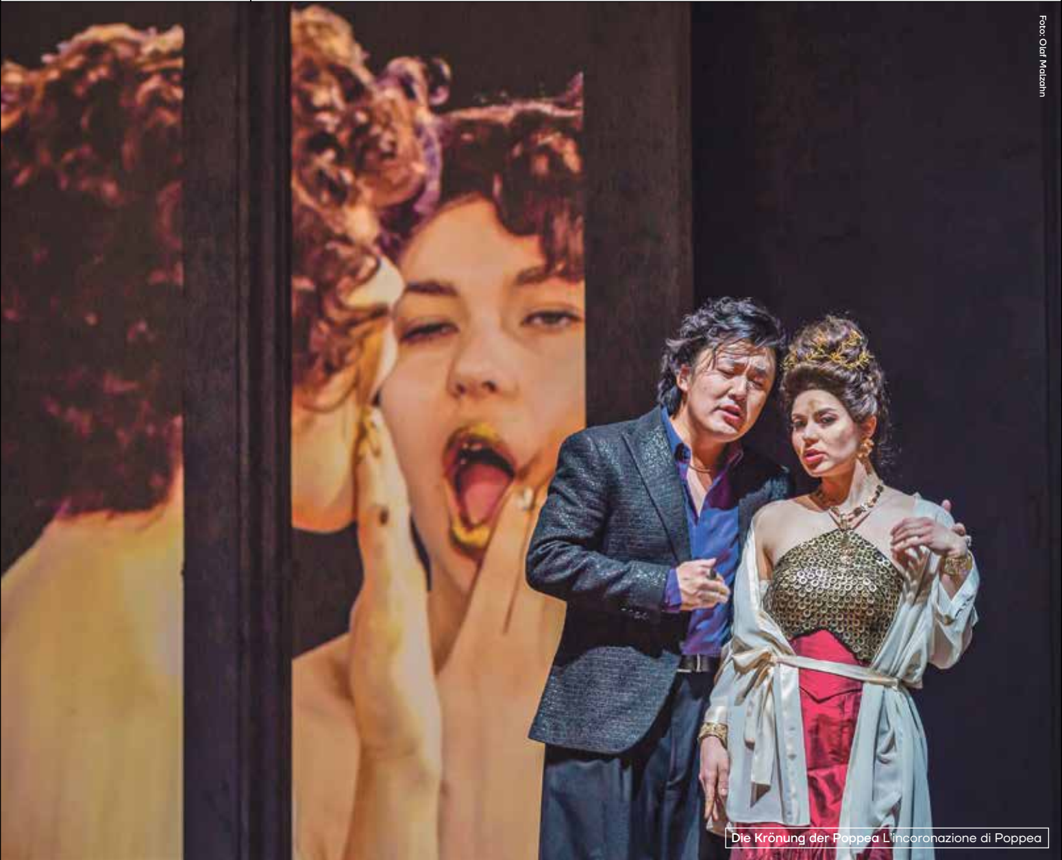
Die Krönung der Poppea L'incoronazione di Poppea

7. Sinfoniekonzert · 8. Sinfoniekonzert · Festkonzert Romely Pfund · 6. Kammerkonzert · 4. Kinderkonzert Ritter Gluck · Konzert der Orchesterakademist:innen Konzerte