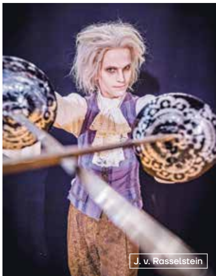
J. v. Rasselstein